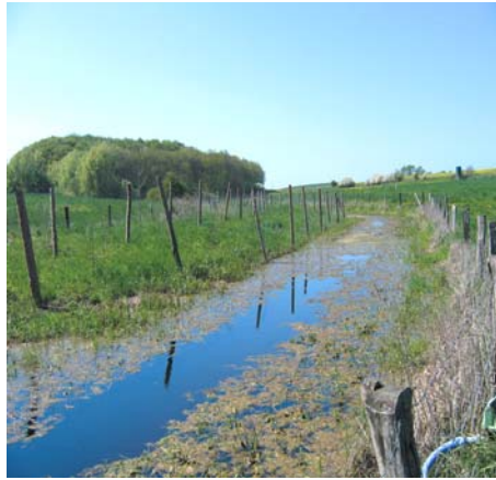
Die Steinerne Rinne bei Campow nach der Renaturierung

Die „Steinerne Rinne“ verbindet im Norden des Biosphärenreservates den Ratzeburger See mit dem Mechower See. Der Bach verlief ehemals als Grenzgewässer zwischen der BRD und der DDR. Er wurde in den siebziger Jahren begradigt und ‚in Rohre gezwängt, unter die Erde verbannt. Die „Steinerne Rinne“ war jahrzehntlang mehr Graben als Bach. In einem länderübergreifenden Renaturierungsprojekt erhielt sie nun ihren Platz in der Landschaft zurück. Die Beton-schächte und Verrohrungen wurden zurückgebaut und die Bachsohle im Bereich der Kerbtäler bei Utecht mit Steinen befestigt. Gebaut wurde generell in biologischer Bauweise z.B. mit Holz und Lesesteinen. Auf den angrenzenden extensiven Grünlandflächen wurde der Wasserstand teilweise erhöht. Neu angelegte Gehölzgruppen