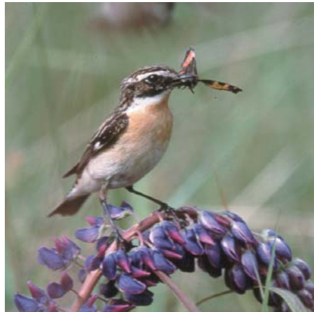
Braunkehlchen und geflecktes Knabenkraut sind zwei Arten von vielen, die von der naturschutzgerechten Grünlandnutzung profitieren.

Seit 1991 werden im Biosphärenreservat Grünlandflächen naturschutzgerecht genutzt. Im ersten Jahr wurden lediglich 50 ha vertraglich gebunden, heute sind es 1260 ha. Die Landwirte düngen die Vertragsflächen nicht und verwenden darauf keine Pflanzenschutzmittel oder Klärschlämme. Dadurch finden hier viel mehr Arten Lebensraum als auf intensiv genutzten Flächen. Während auf intensiv bewirtschaftetem Grünland maximal 5 bis 20 Pflanzenarten vorkommen, sind es auf