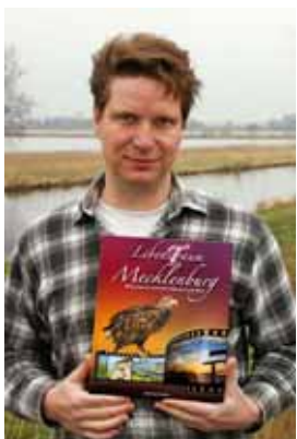
Autor Burkhard Fellner

Mecklenburg, die Heimat vor der Haustür, hält für alle Radfahrer, Wanderer und Bootsfahrer einen unermesslichen Naturreichtum bereit.