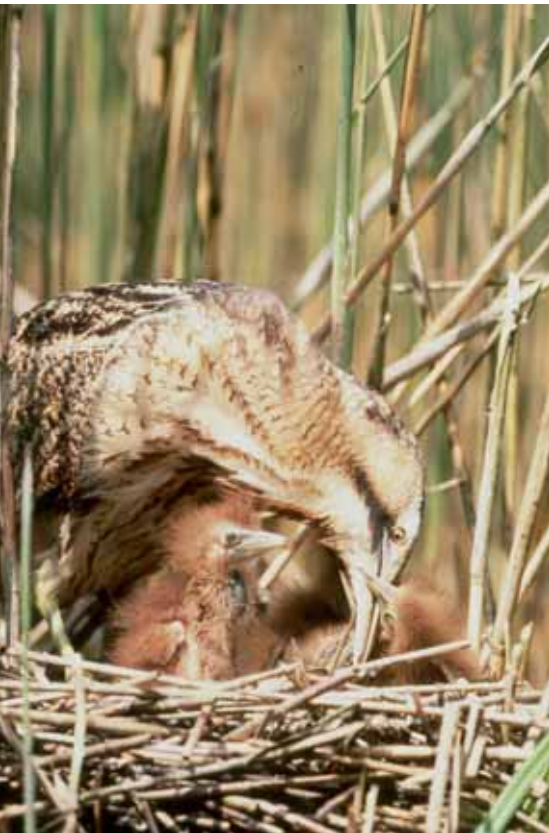
Große Rohrdommel Botaurus stellaris

Es gibt's sie noch im Biosphärenreservat Schaalsee und mit etwas Glück kann man sie auch hören – die Große Rohrdommel. Sehen werden sie allerdings die wenigsten Menschen, denn der Vogel lebt nicht nur sehr